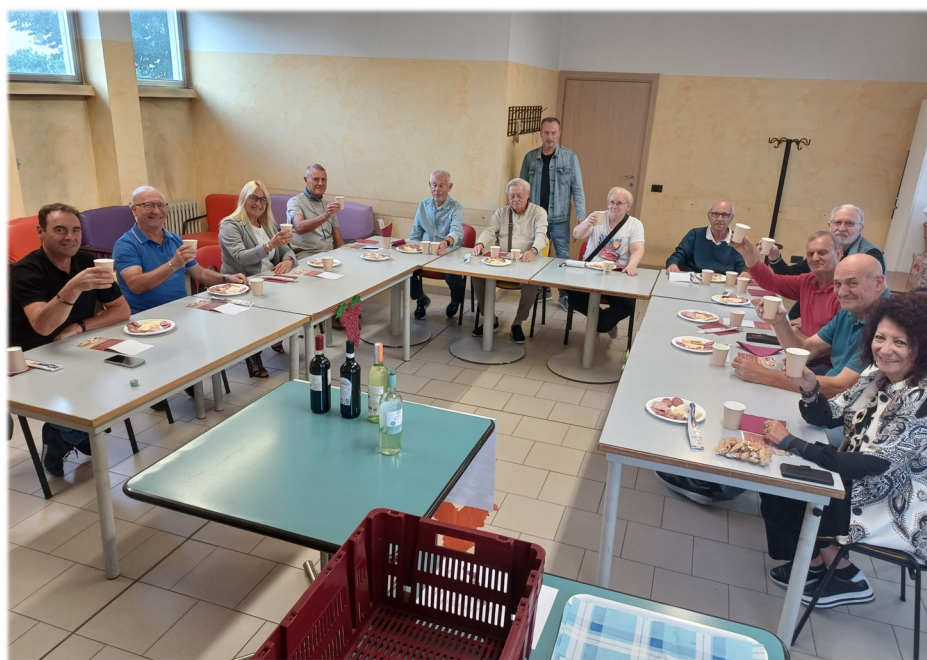
4° Percorso enogastronomico - Vini dell'Umbria