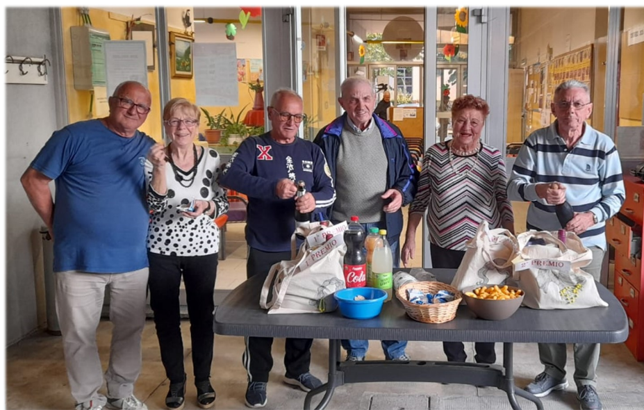
Torneo di Bocce